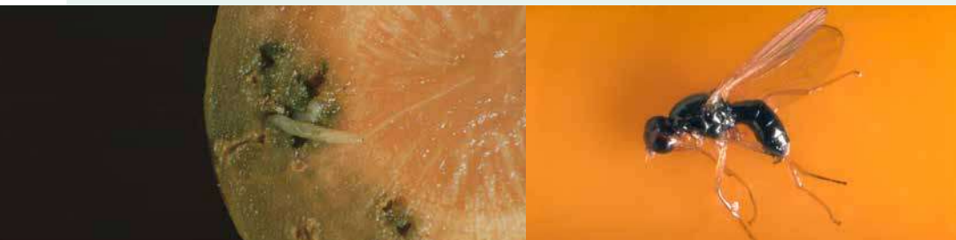
Larve et adulte de la mouche de la carotte ( Psila rosae )

Surveillance du vol de la mouche de la carotte ( Psila rosae )