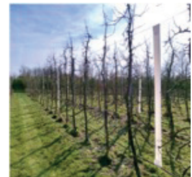
Exemple de pose en vergers palissés

Agrafer en haut et en bas des fils de palissage afin de renforcer la tenue des bandes.