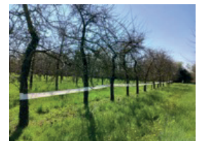
Exemple de pose en vergers non palissés